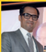
MOHAMMED DEWJI Tanzanie - 40 ans Président-directeur général MeTL GROUP